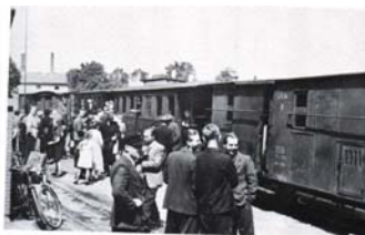
Letzte Fahrt am 17. 5. 1982 (in Quakenbrück)

Dieses Jubiläum „Kleinbahn Lingen–Berge–Quakenbrück“ wollen wir am 08. und 09. Mai feiern und laden schon heute dazu ein. Die Einzelheiten des Programms werden noch veröffentlicht.