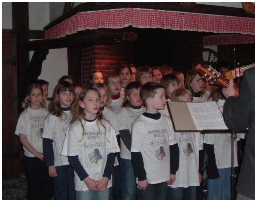
Der Berger Kinderchor am „Besinnlichen Adventsabend“ im Heimathaus