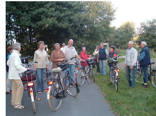
Radwanderung im Sommer 2008

An der Frühjahrswanderung am 15. März, 14.00 Uhr , nimmt mit unseren Berger Wanderern eine Wandergruppe aus Osnabrück teil und wir möchten allen Teilnehmern schöne Wanderwege rund um Berge vorstellen. Zur anschließenden Kaffeetafel laden wir herzlich in unser Haus ein.